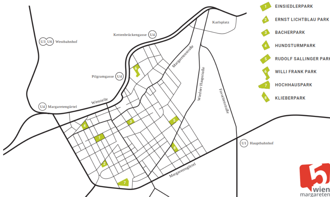
Abbildung 1: Betreuungsgebiet des Vereins Institut für Erlebnispädagogik im 5. Wiener Gemeindebezirk