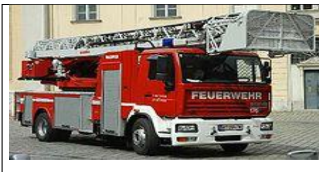
Abbildung 4: Drehleiterfahrzeug

Zusätzlich gehörte zu einer Löschbereitschaft ein Drehleiterfahrzeug mit einer Besatzung von zwei Personen. Diese bestand somit aus einer Fahrzeugkommandantin bzw. einem Fahrzeugkommandanten und einer Maschinistin bzw. einem Maschinisten.