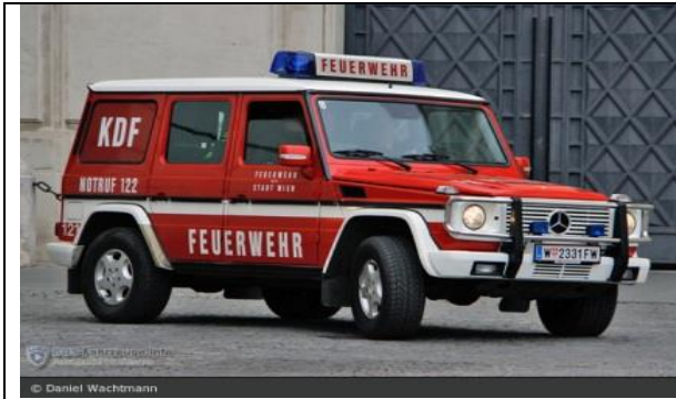
Abbildung 2: Kommandofahrzeug

Ein Kommandofahrzeug mit einer Besatzung von vier Personen. Diese vier Personen waren die Bereitschaftsoffizierin bzw. der Bereitschaftsoffizier, die Zugskommandantin bzw. der Zugkommandant, die Sektionsfahrmeisterin bzw. der Sektionsfahrmeister und die Melderin bzw. der Melder.