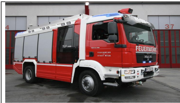
Abbildung 3: Löschruppenfahrzeug

Weiters bestand die Löschbereitschaft aus drei Löschruppenfahrzeugen mit einer Besatzung von jeweils sechs Personen. Diese setzte sich aus einer Maschinistin bzw. einem Maschinisten, der Gruppenkommandantin bzw. dem Gruppenkommandanten und vier Feuerwehrfrauen bzw. Feuerwehrmännern zusammen.