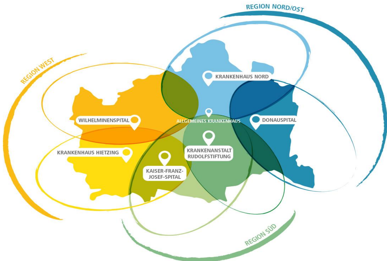
Abbildung 1: Versorgungsregionen laut Masterplan

Quelle: Krankenanstaltenverbund, Darstellung: Krankenanstaltenverbund