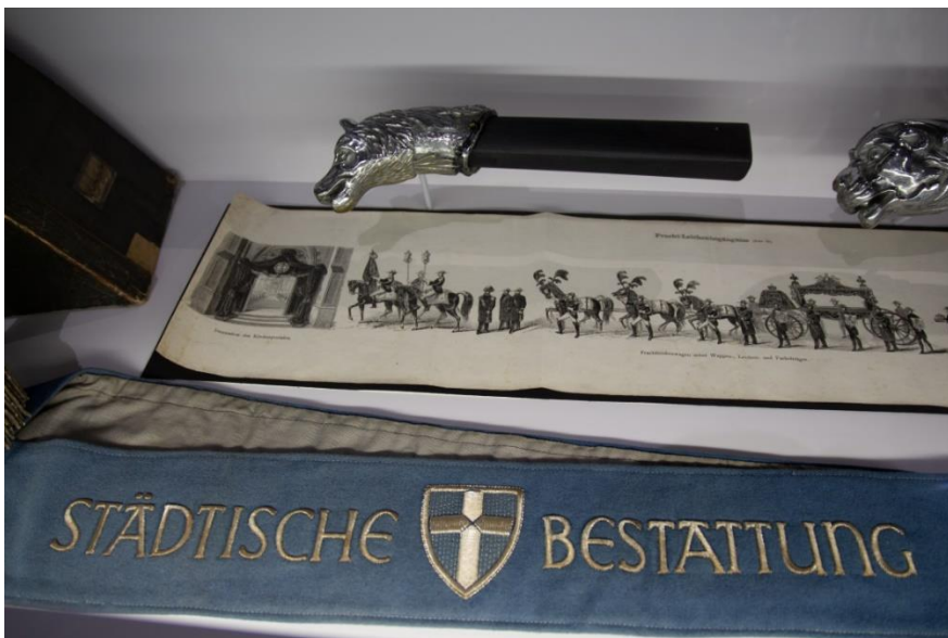
Abbildung 7: Hauptschauraum, Trauerzug