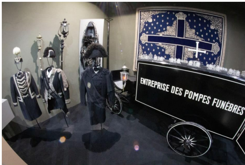
Abbildung 2: Hauptschauraum, Bild 1