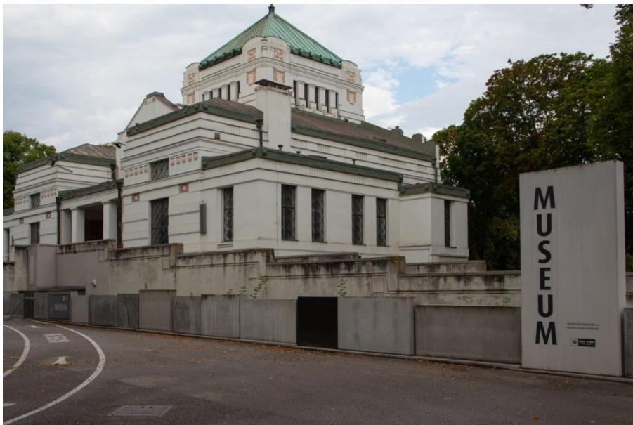
Abbildung 1: Aufbahrungshalle 2 am Wiener Zentralfriedhof - Außenansicht