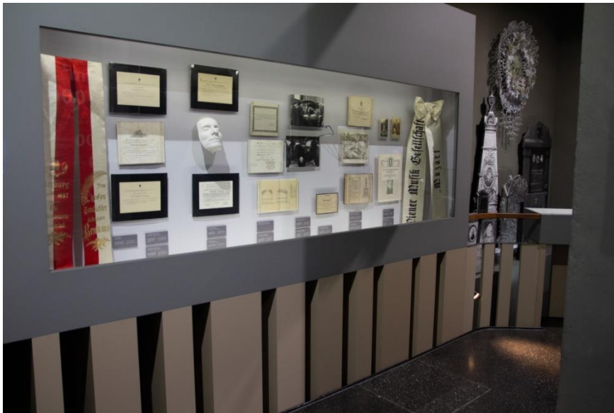
Abbildung 6: Ausstellungsraum Friedhöfe, Bild 3