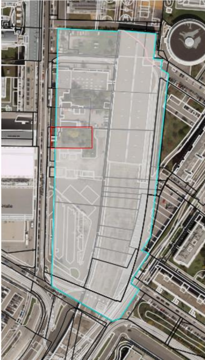
Abbildung 3: Wien 22, Attemsgasse 4, im Gebiet des Remisenprojektes