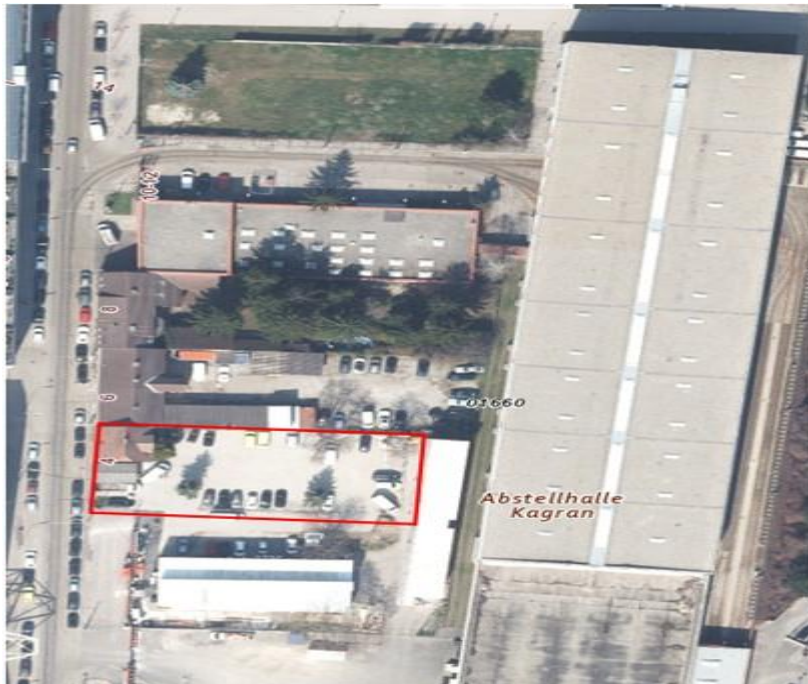
Abbildung 2: Luftaufnahme Bahnhof Kagran mit eingezeichneter Liegenschaft in Wien 22, Attemsgasse 4