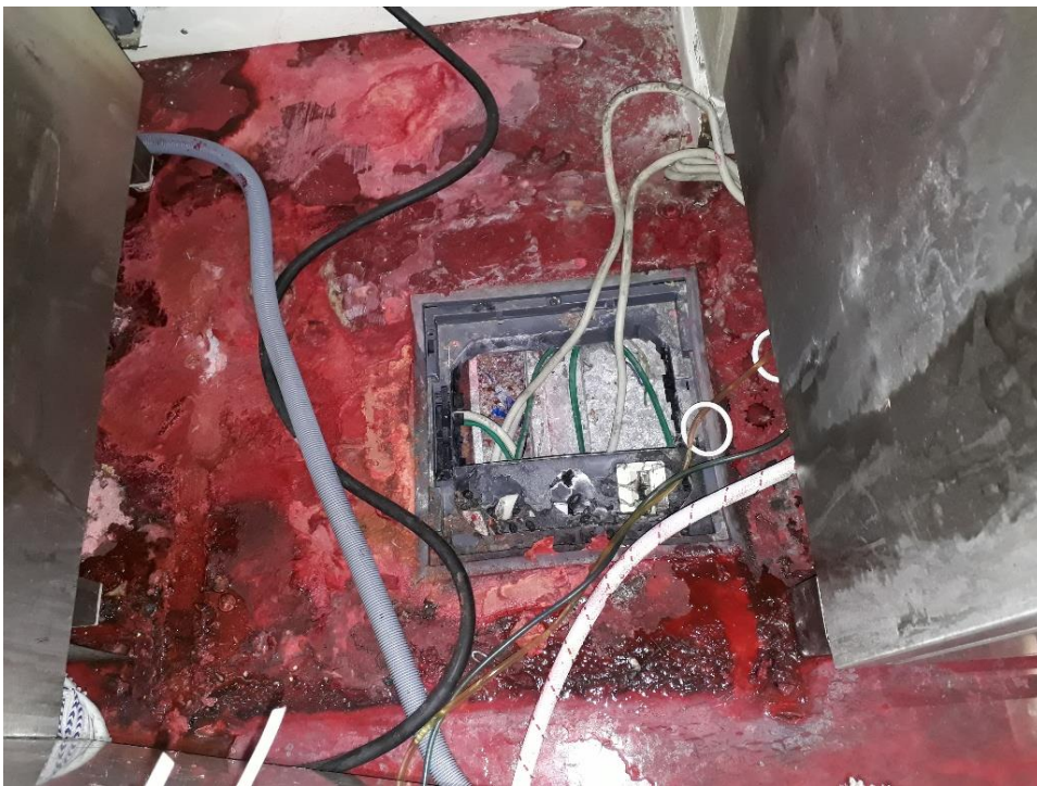
Abbildung 6: Bodendose und zur Seite geschobener Geschirrspüler

im Sozialraum auf, sondern durch ein Tropfen von der Brandschutzdecke auf die darunterliegende Gleisanlage der U-Bahnlinie U6. Da die Schadensursache vorerst unbekannt war, wurde mit einer Wärmebildkamera versucht, die Feuchtigkeitsquelle aufzuspüren. Zuerst wurde eine defekte Kondensatableitung der Ventilatorkonvektoren vermutet. Dieser Verdacht bestätigte sich jedoch nicht. Im Zuge der weiteren Untersuchung wurde eine nasse Wand entdeckt. Aufgrund deren Lokalisation hinter aufgestellten Getränkeautomaten wurde ein defekter Automat als Schadensquelle in Betracht gezogen. Auch dieser Verdacht erwies sich als unrichtig. Im Verlauf der weiteren Schadensverfolgung wurde der Geschirrspüler aus der Verkleidung gezogen. Dadurch war sichtbar, dass sich im Boden unter dem Geschirrspüler eine Verteilerdose befand, deren Abdeckung fehlte (s. Abbildung 6). Der Geschirrspüler, ein Industriegerät, war außerdem undicht. Da dieser immer wieder Frischwasser bis zum Erreichen der Sollwassermenge nachpumpte, kam ein ständiger Wasserfluss zustande, welcher über die daruntergelegene Verteilerdose und die weiterführenden Kabelkanäle abfloss. Der anfänglich festgestellte Wasserschaden befand sich ca. 20 m vom defekten Geschirrspüler entfernt.