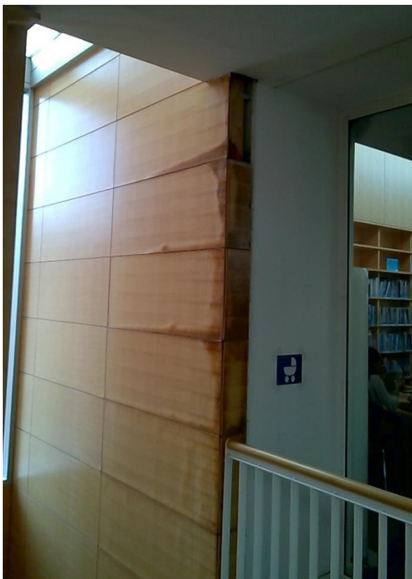
Abbildung 3: Vom Wassereintritt betroffene Wand im College 5

Im März des Jahres 2016 fiel erstmalig auf, dass Wasser von der Decke des College 5 im dritten Obergeschoß in den Bereich des College 1 im zweiten Obergeschoß der Hauptbücherei tropfte. Im Zeitraum danach war lt. Angabe der Magistratsabteilung 34 für ca. ein halbes Jahr kein Wasseraustritt im Gebäudeinneren feststellbar. Im Oktober des Jahres 2016 kam es zu einer neuerlichen Meldung eines Wasseraustritts, ersichtlich an einer Wandverkleidung (s. Abbildung 3).