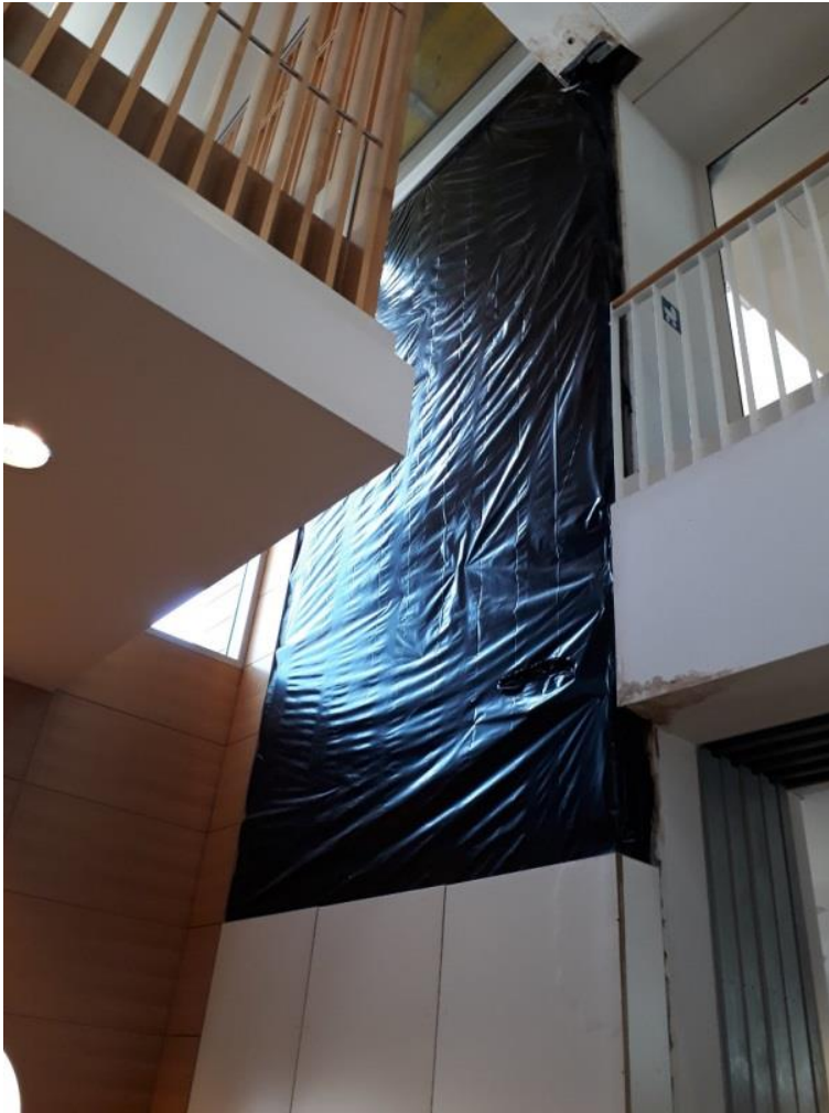
Abbildung 4: Vom Wassereintritt betroffene Wand im College 1 und College 5 ohne Verkleidung