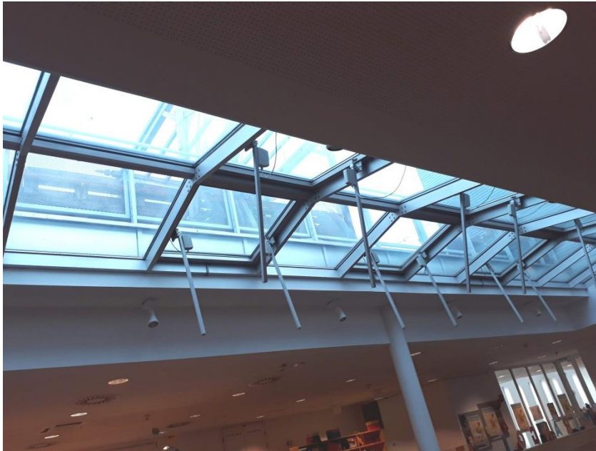
Abbildung 5: Oberlicht über College 4