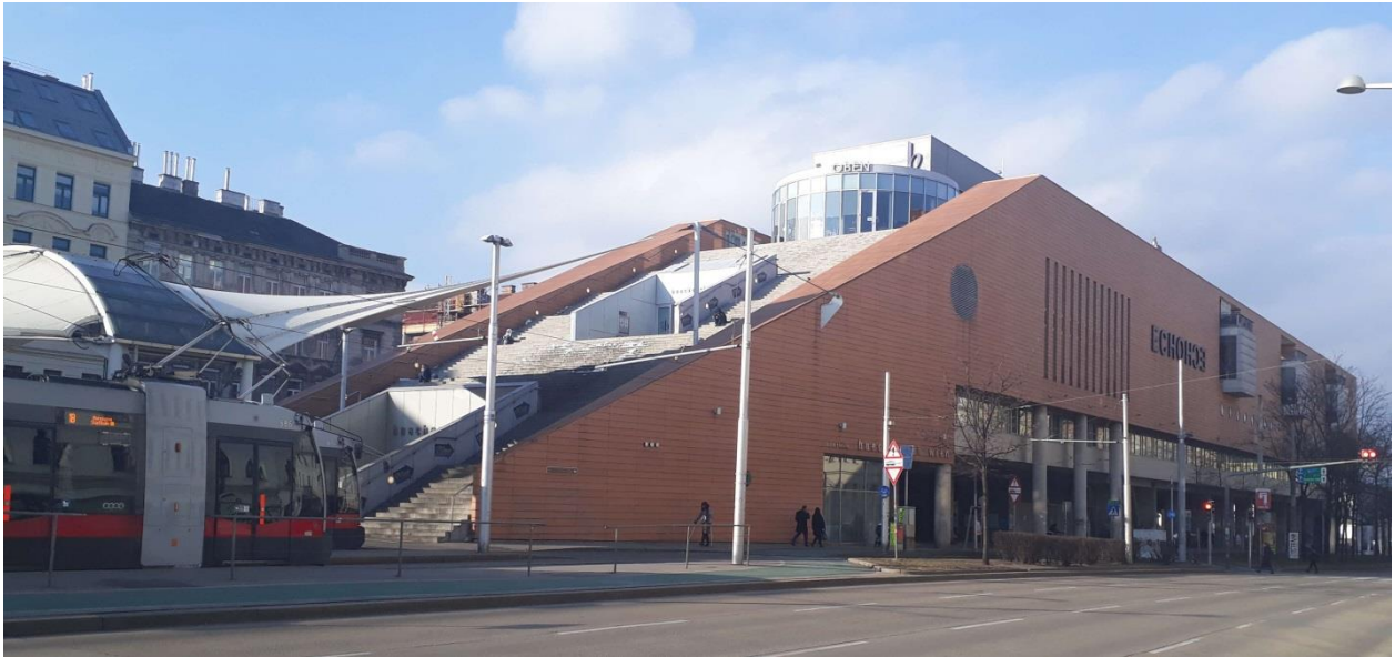
Abbildung 1: Hauptbücherei am Urban-Loritz-Platz