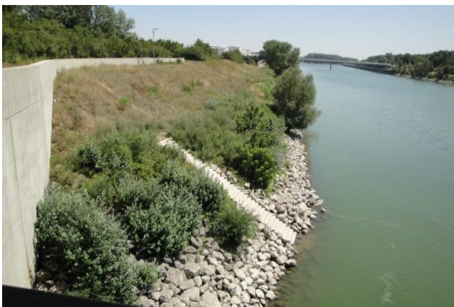
Abbildung 3: Treppenabgang zum Unterwasser (linkes Ufer)

Zur Verbesserung der betrieblichen Gegebenheiten wurden zwei Treppenabgänge zum Unterwasser hergestellt.