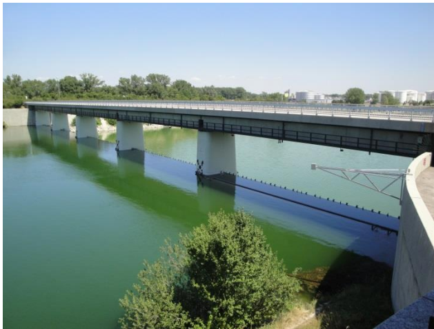
Abbildung 1: Wehranlage und Wehrbrücke

Die Wehrbrücke besteht aus fünf vorgespannten Einfeldträgern mit Hohlkastenquerschnitt und Einzelstützweiten von 31,90 m. Die Wehrpfeiler sind als Hohlpfeiler konstruiert, wobei diese u.a. als Stützkonstruktion für die Wehrbrücke dienen. Am rechten Ufer der Neuen Donau ist die Wehrwarte situiert, wobei diese sämtliche Steuer- und Leiteinrichtungen für den Betrieb der Wehranlage sowie Aufenthaltsräume beinhaltet.