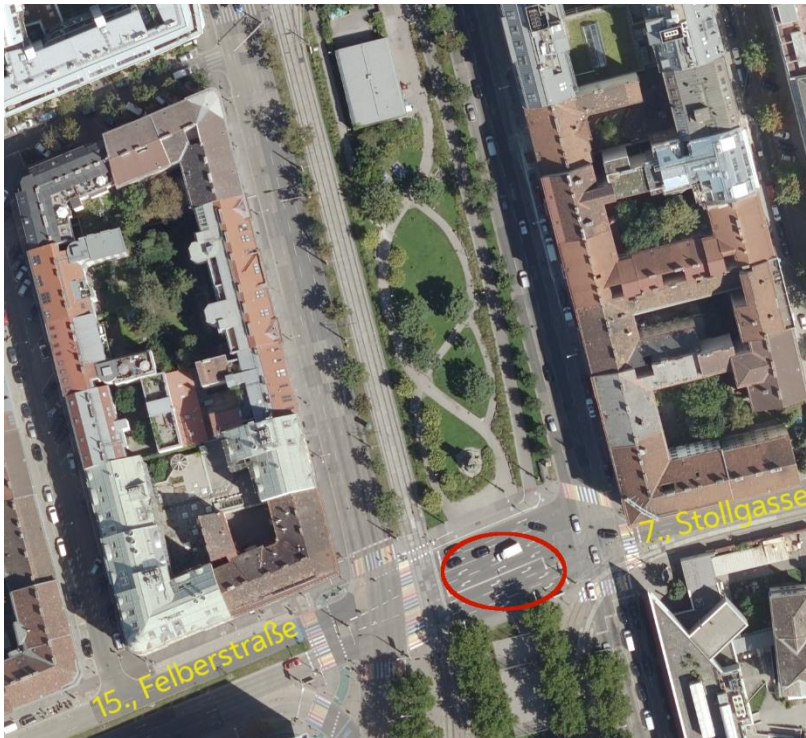
Abbildung 1: Standort Gürtelfrische West, Stollgasse-Felberstraße

Quelle: MA 41 - Stadtvermessung, Darstellung: Stadtrechnungshof Wien