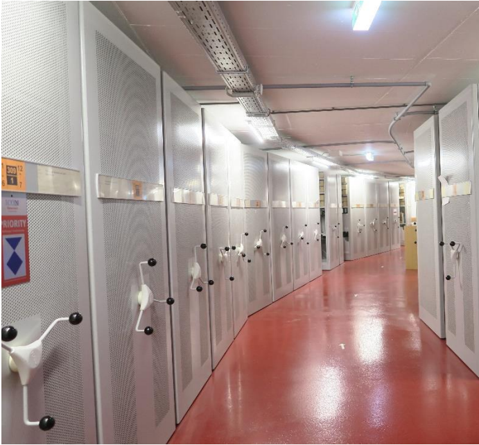
Abbildung 2: Ansicht eines mit Drehstern bedienten Fachbodenregalbereichs